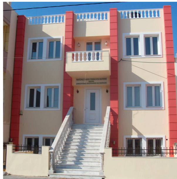
ΚΕΝΤΡΟ ΔΗΜΙΟΥΡΓΙΚΗΣ ΑΠΑΣΧΟΛΗΣΗΣ ΚΑΙ ΕΚΦΡΑΣΗΣ ΠΟΛΙΤΙΣΤΙΚΟΥ ΣΥΛΛΟΓΟΥ ΑΓΙΑΣ ΑΙΚΑΤΕΡΙΝΗΣ (ΝΕΟ ΙΔΙΟΚΤΗΤΟ ΚΤΙΡΙΟ)

ΟΙ ΕΚΔΗΛΩΣΕΙΣ ΚΑΘΗΜΕΡΙΝΑ ΘΑ ΠΡΑΓΜΑΤΟΠΟΙΟΥΝΤΑΙ ΣΥΜΦΩΝΑ ΜΕ ΤΟ ΠΡΟΓΡΑΜΜΑ, ΣΤΟ ΠΑΡΚΟ ΜΠΡΟΣΤΑ ΣΤΗΝ ΕΚΚΛΗΣΙΑ ΤΗΣ ΑΓΙΑΣ ΑΙΚΑΤΕΡΙΝΗΣ. ΩΡΑ ΕΝΑΡΣΗΣ 9μ.μ. Η ΕΙΣΟΔΟΣ ΕΙΝΑΙ ΕΛΕΥΘΕΡΗ. ΠΑΡΑΚΑΛΟΥΜΕ ΝΑ ΕΙΣΤΕ ΣΥΝΕΠΕΙΣ ΣΤΗΝ ΩΡΑ ΕΝΑΡΣΗΣ ΤΩΝ ΕΚΔΗΛΩΣΕΩΝ.